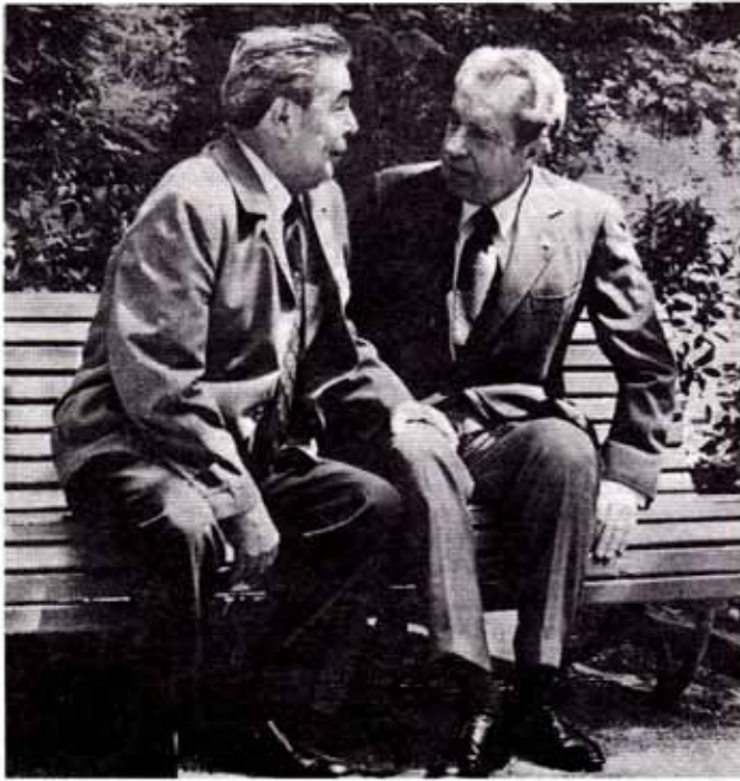
نیکسون و پرزف

گروههای وابسته به مسائل محیط زیست، گروه صلح، شخصیت‌های مهم، فرمانداران ایالات، شهرداران و دیگر افرادی شد. فرانک جنگرز بعنوان رابط اصلی داتان و آرامکو پیشنهادات او را به مقامات سعودی و آرامکو تسلیم میکرد. در اوائل ژانویه ۱۹۷۴ جنگرز طی نامه‌ای از گزارشهای سه گانه داتان اظهار تشکر کرده و اضافه کرده بود که دو گزارش اول رابه یمنانی داده و در نظر دارد نسخه‌ای از آنها را نیز برای کمال ادهم داماد ملک فیصل که ضمناً رئیس سازمان امنیت سعودی بود بفرستد. داتان در نامه‌ای به جنگرز اصرار ورزیده بود که بعنوان تنها مسئول اجرایی شناخته شود و مستقیماً با کمال ادهم و سایر مقامات سعودی در ارتباط باشد و براساس حق ترجمه روزانه یکپنجاه دلار پیشنهاد کرده بود قرارداد سه ساله‌ای بمبلغ شصدهزار دلار با او منعقد شود و هرگاه سناتور فولبرایت مستقیماً از طرز عمل او راضی نباشد و یا بهر دلیل دیگر، قرار داد قابل لغو باشد. در پایان نامه اضافه کرده بود فوراً اقدام کنید، اینکارها میبایستی شش ماه قبل و حتی ۲۵ سال قبل شروع شده باشد.